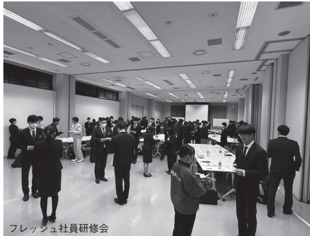
フレッシュ社員研修会

入社して5年以内の新入社員を対象にしたフレッシュ社員研修会、次期リーダー候補、中堅社員を対象にしたチームリーダー研修が4月に相次いで開かれた。フレッシュ社員研修会は、ビジネスマナーなど企業が求める基本的なスキルを、チームリーダー研修は成果を出すためのコミュニケーションスキルやセルフコントロールに焦点を絞り、いずれもロールプレイング形式で進められた。社内での立場は異なっても、社内外での良好な人間関係構築の必要性が説かれる内容だった。