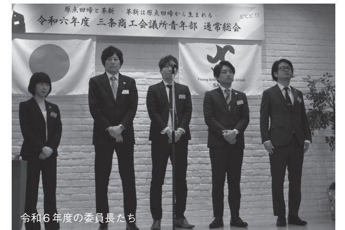
令和6年度の委員長たち