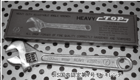
JIS国内認定第1号モンキレンチ