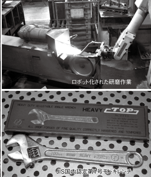
ロボット化された研磨作業