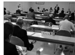
被表彰者は以下の通り。 敬称略、カッコ内は事業所名。